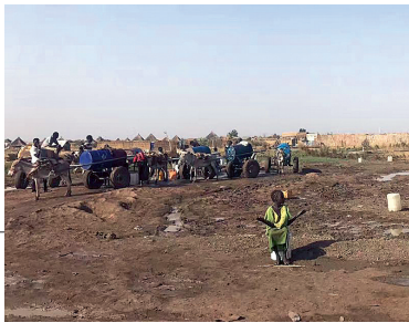
南苏丹当地情况(资料图片)

目前,南苏丹全境共设有9个难民营,难民人数与维和警察人数比达1300:1。维和警察的主要工作是负责难民营区的难民保护、秩序维护和协助开展人道主义援助等工作,往往需要在难民营工作至深夜,清查、处理各种案件和突发性事件,需要三班倒、24小时轮岗……这一切,对即将去南苏丹维和1年的中国(浙江)第六支赴南苏丹维和警队,都将是严峻考验。