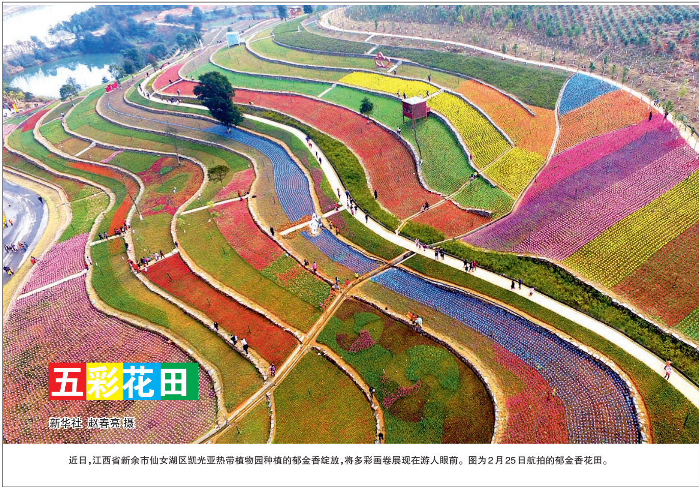
近日,江西省新余市仙女湖区凯光亚热带植物园种植的郁金香绽放,将多彩画卷展现在游人眼前。图为2月25日航拍的郁金香花田。

等3个维度加强行业监管;此次“两天两重罚”释放了“严”字当头的信号,险企的公司治理等将成为监管部门今年重点监管的领域。 当然,一些专家也指出,在看到监管机构对个别“坏孩子”敲响警钟的同时,也要看到多数保险机构秉持财务投资、长期投资、价值投资的理念,日渐成为经济发展的稳定器、人民生活的保障器、实体经济的助推器。 冯澍认为,眼下保险资金运用出现的问题,诸如个别保险公司的少数控股股东把保险公司作为融资平台,集中举牌、一致行动人并购等,需要用发展、改革的思路去解决问题。“新问题的出现,也对监管工作提出了挑战,要求监管部门不断自我提升,不断增加武器库的新家伙,监管要‘长牙’。”冯澍说。 不少分析人士认为,在加强监管的同时,保险业相关基础设施建设也亟待完善。国务院发展研究中心金融研究所研究员朱俊生认为,去年开始保险行业的一系列争议事件暴露了不少问题,需要通过完善规则,让保险资金更好地成为价值投资者;同时,保险行业还要建立完善市场化的退出机制,防止劣币驱逐良币现象发生。 “让违法违规者付出高昂代价,才能最大程度遏制不法行为。”保监会负责人近期表示,对个别浑水摸鱼、火中取栗且不收敛、不收手的机构,依法依规采取顶格处罚,坚决采取停止新业务、处罚高管人员直至吊销牌照等监管措施。