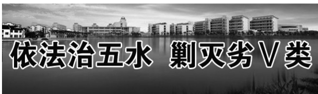
依法治五水 剿灭劣V类