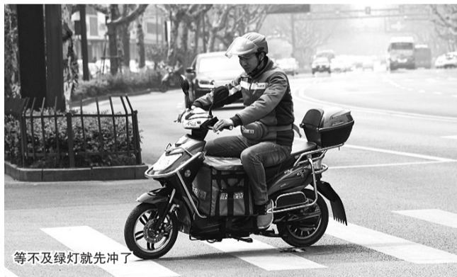
等不及绿灯就先冲了

12:10,一名准备穿越马路的快递小哥正在等待绿灯,也许是时间来不及了,他环顾左右,瞅准了一个空当,当着红灯的面,穿过马路,一溜烟地去了。