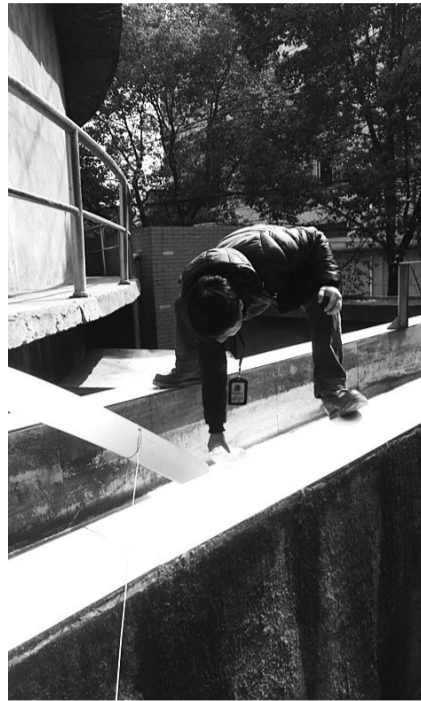
执法人员现场取样

也就在今年3月,杭州江干区公安分局“河道警长”发现江干机场港(笕桥机场段)北岸有小作坊将未处理工业废水接入附近河道后,主动与区环保分局对接。3月17日,江干警方会同区环保分局对江干机场港(笕桥机场段)沿岸开展集中整治,查获3家玻璃和塑料加工小作坊将工业废水未经处理直接排入河道。随后,警方对17名相关责任人员进行传唤,目前已有7人被处以行政拘留。