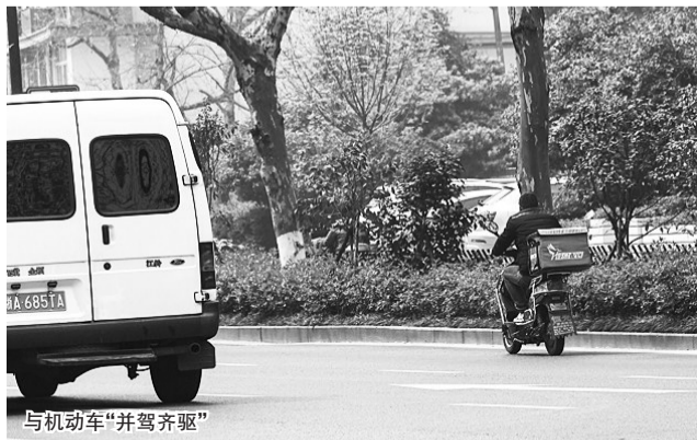
与机动车“并驾齐驱”

12:14,绿灯时亮起,一名快递小哥穿过马路后,并没有拐入非机动车道,而是直接上了机动车道,与汽车“并驾齐驱”。