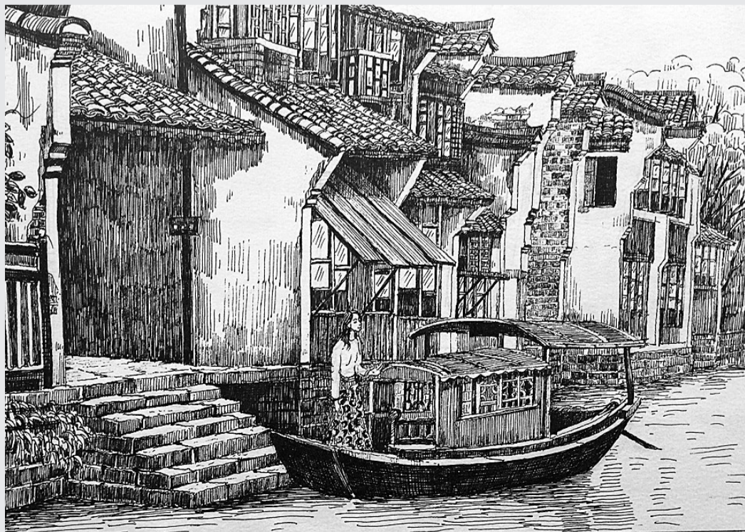
南湖监狱一监区三分监区 楼敏华 水乡乌镇