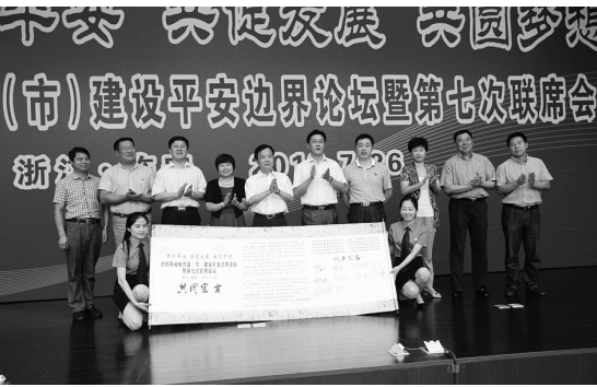
浙皖两省毗邻县(市)建设平安边界论坛暨第七次联席会议

每年,一到山核桃采摘季节,临安清凉峰镇农户都会邀请毗邻地区务工人员帮忙采收山核桃。来自安徽歙县金川