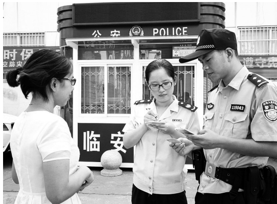
四级机关党员干部走进治安岗亭 24小时无灯值守

“四圈两网”、“楔子工程”、“天网”工程、“两网”融合……近年来,临安将平安作为群众的第一呼声,着力构建专群结合、点线面覆盖、人防物防技防联控、打防管控一体化的立体化社会治安防控体系,切实提高社会治安防控能力。