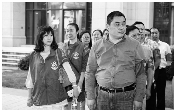
平安调解队、网格长参与矛盾纠纷化解