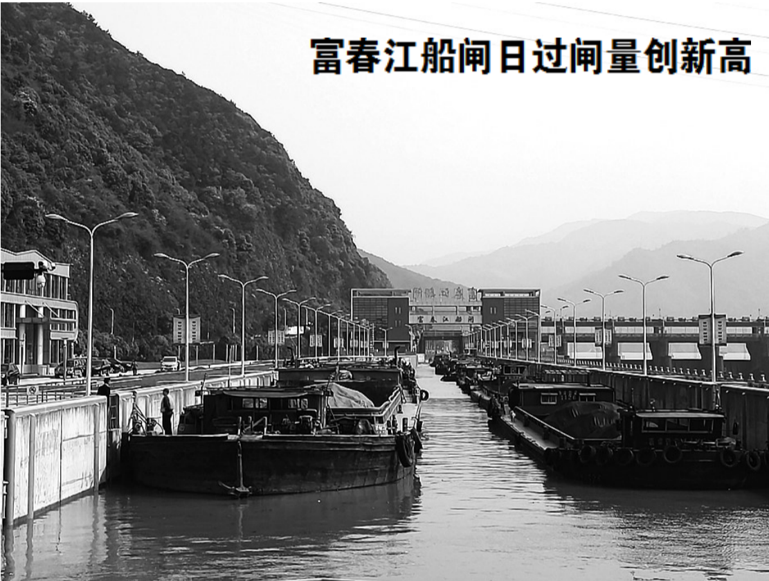
通讯员 方明君 厉永滨

2016年9月27日,李某某等22人因涉嫌非法捕捞罪被公安机关移送玉环县检察院审查起诉。 办案检察官经仔细审查发现,22人虽均参与非法捕捞,但地位作用、分工及获利情况悬殊。比如其中的李某某,她是幕后老板和提议者、主导者,也是最大获利者;船东吴某某和船老大兰某某,指挥船员进行捕捞,也是主要获利者;而两艘船上的19名船员,仅领取固定工资,且直至案发时领到的也只是出海前船老板给的补贴家用的两三千元,在非法捕捞过程中没有明显积极主动的行为。因此,应当对22名犯罪嫌疑人根据各自在案中所起的作用进行区分,而不是一概而论。依据宽严相济的刑事政策,最终,玉环县检察院作出决定,对3名主要获利者以涉嫌非法捕捞水产品罪提起公诉,而对19名船员依据各自出海次数,分别作定罪不起诉和不追究刑事责任处理。