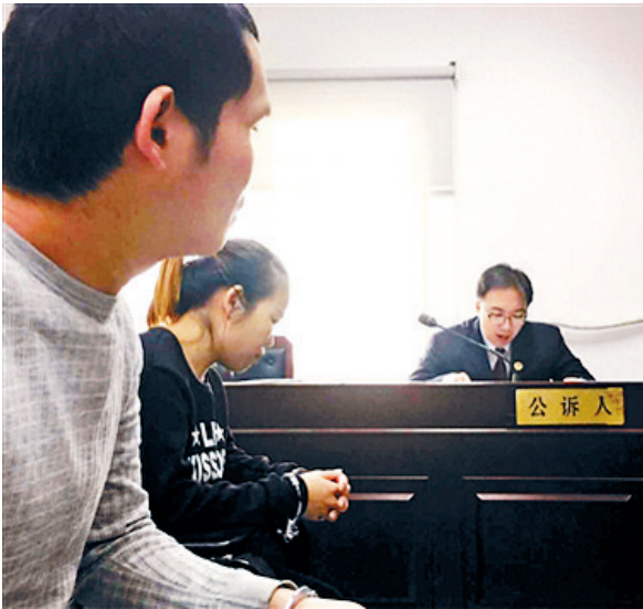
涉嫌组织卖血双双被判

一对远房姐弟,姐姐曾是医院护工,弟弟长期组织他人卖血。工作期间,姐姐在了解到医院经常出现季节性缺血情况后,加入到弟弟的卖血团伙中,负责在医院发放卖血小卡片,出售血源。后两人因涉嫌非法组织卖血罪被起诉。17日上午,北京市朝阳区法院公开审理此案,最终法院分别判决犯罪嫌疑人有期徒刑10个月和有期徒刑7个月。