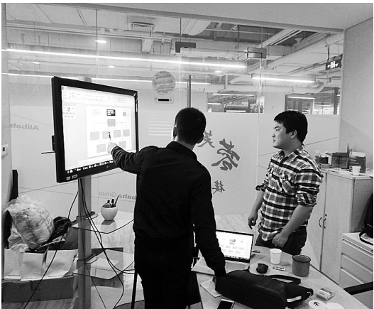
打假特战队队员与经侦民警进行案件研判