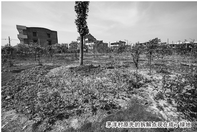
茅洋村原先的拆解点现在成了绿地