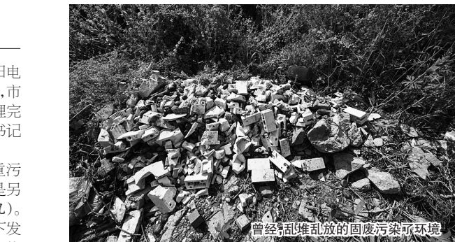
曾经乱堆乱放的固废污染环境