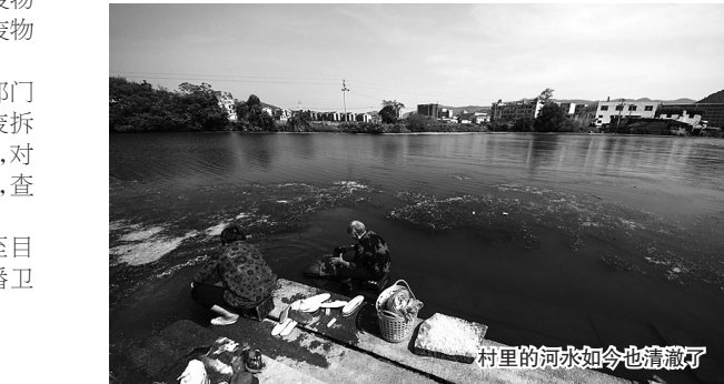
村里的河水如今也清澈了