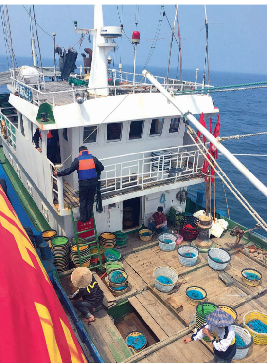
队员们登船检查,确认为海钓船

这一路,没有遇上一艘违法作业的渔船,我用“没有情况就是好情况”安慰自己,也为船员们感到庆幸。因为我知道,一旦真有情况,他们面对的又将是一场动真碰硬的较量。