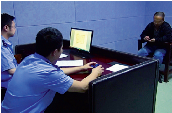
喻某听到他母亲为其圆坟后才实施抓捕,流下了悔恨的泪水

恶意骚扰110是违法行为,对拨打110取乐、滋扰公安机关工作秩序或报假警等行为,公安机关将按照法律的有关规定,依法进行处罚和打击。除了视情予以批评教育或依据《治安管理处罚法》有关条款处理外,对于报假警造成严重后果触犯刑律的,公安机关将追究刑事责任。