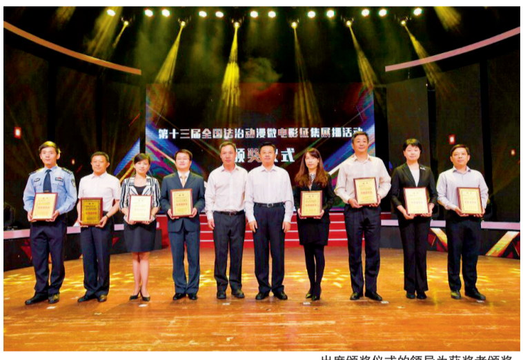
出席颁奖仪式的领导为获奖者颁奖

式不断创新、范围不断扩大、质量不断提高,为新媒体普法提供了大量优秀作品,为人民群众提供了多样化的学法渠道,产生了良好的社会效果。各地各部门要以此为契机,努力深化“互联网+法治宣传”行动,进一步强化互联网思维,把握互联网普法规律,充分运用互联网传播平台,积极打造全媒体普法平台,不断扩大互联网法治宣传的影响;要广泛开展新媒体法治宣传主题活动,灵活运用新媒体普法阵地,广泛开展以案释法,深入宣传习近平总书记系列重要讲话精神,特别是关于全面依法治国的重要论述,不断增强法治宣传教育实效;要加强新媒体普法产品的应用,以满足人民群众需求为目标,针对不同时期不同地域不同群体的需求,分类推送实用价值高、针对性强的新媒体普法内容,推动新媒体普法精准化。 颁奖仪式结束后,赵大程与国家网信办网络社会局副局长孙爱萍、浙江省人民政府副秘书长李岩益、浙江省司法厅厅长马柏伟等共同按下激光启动球,这也标志着正式拉开第十四届全国法治动漫微电影征集展播(映)活动的序幕。