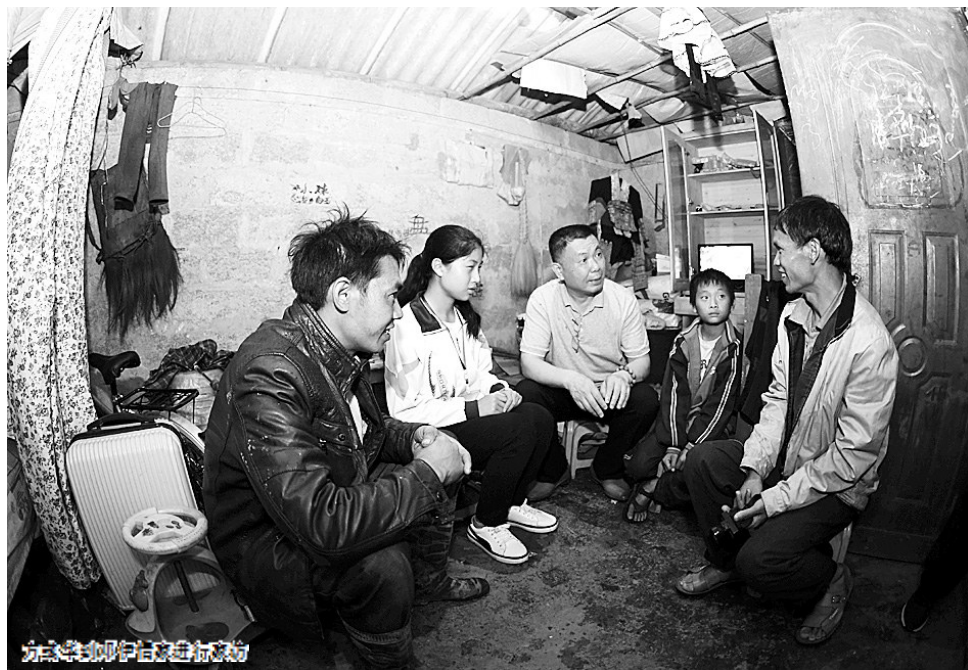
方或华到金平看望当年送鸡蛋的农户