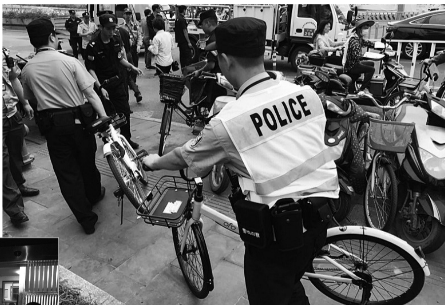
通讯员 徐佳 傅宏波 胡学军 赵鏊杰 杨勇 本报记者 陈洋根

6月7日,杭州警方在全市范围内组织开展“扬旗”1号行动(暨夏季严打整治行动)首次集中统一行动。