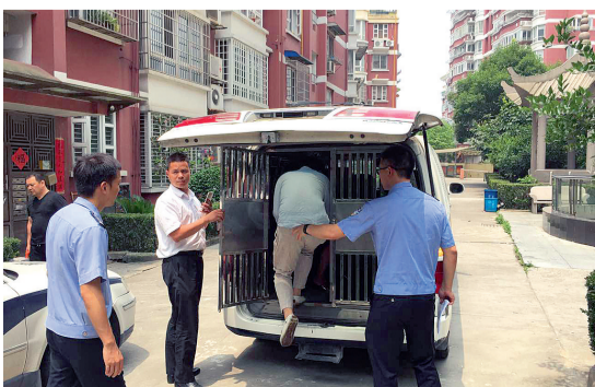
执行法官将一名“老赖”司法拘留