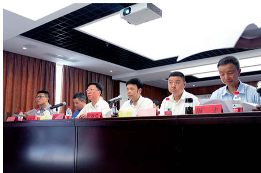
集中指挥,统筹领导

执行三组全体人员统一配备单兵执法记录仪,赶到鹿城区百里西里工会大厦2幢2401室,这里是此次执行行动腾空面积最大的一处房产,达913.98平方米。