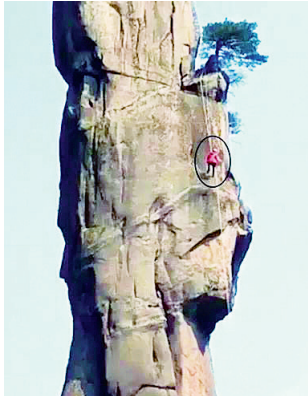
今年4月,游客利用钻孔、打钢钉、挂绳等方式擅自攀爬巨蟒峰。

在这些游客不文明行为中,6起是在境外旅游时发生的,占比31%;5起事件发生在航班上,占比26%;游客与导游发生冲突的事件7起,占比37%。