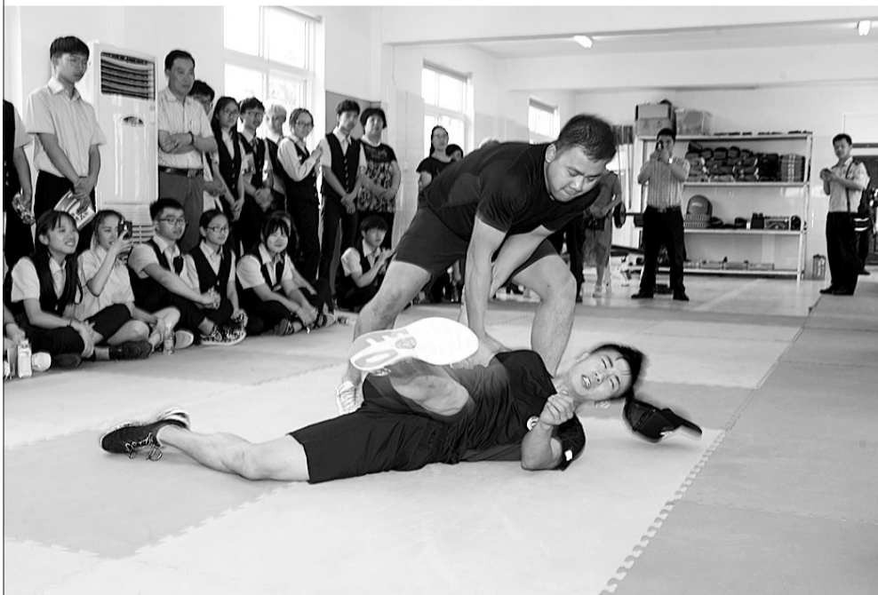
本报记者 郑嘉男 通讯员 高祥 丁海南

昨天,舟山市公安局特警支队举办了以“激越、卓越、超越”为主题的警营开放日活动,邀请市民代表来到支队营区观看特警的格斗技术、排爆模拟等技能演练,向大家展示特警风采。