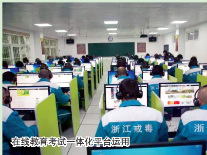
在线教育考试一体化平台运用