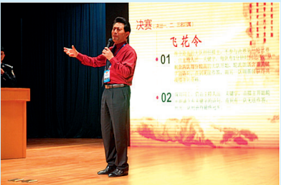
省戒毒公益大使、著名主持人、演员刘忠虎来到省拱宸强制隔离戒毒所“拱宸诗词大赛”现场,凭借扎实的舞台经验和朗诵技巧,轻松地将诗词大赛变成朗诵会和故事会。

不久前,“百名戒毒公益大使百场公益活动”启动。接下来的6个月时间,还会有更多的戒毒公益大使走进我省强制隔离戒毒所,和干警一起,共同帮助戒毒人员戒除毒瘾,走向幸福人生。