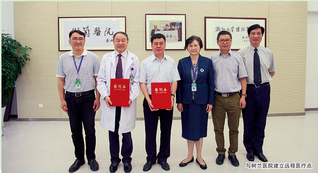
与树兰医院建立远程医疗点