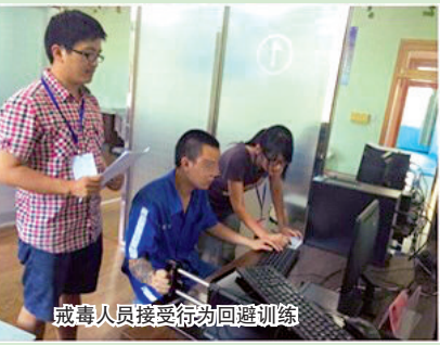
戒毒人员接受行为回避训练