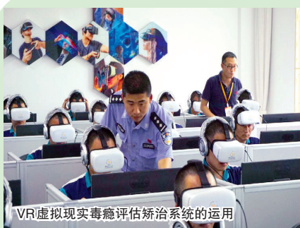
VR虚拟现实毒瘾评估矫治系统的运用