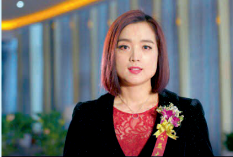
著名歌手白雪走进浙江省十里坪强制隔离戒毒所。