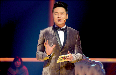
省戒毒公益大使、浙江卫视著名主持人沈涛为省十里坪强制隔离戒毒所拍摄“6·26”戒毒公益宣传片。