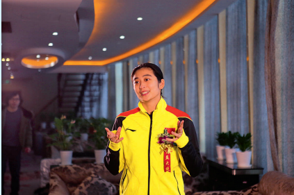
羽毛球世界冠军王琳走进省十里坪强制隔离戒毒所。