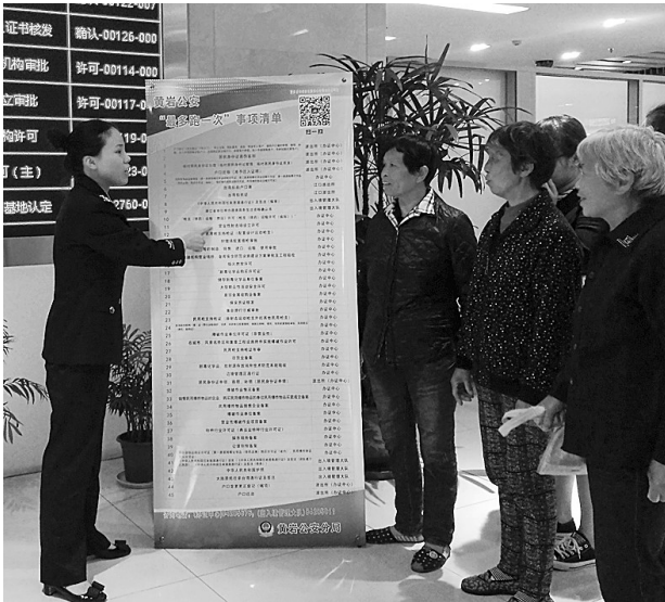
向群众介绍“最多跑一次”事项清单