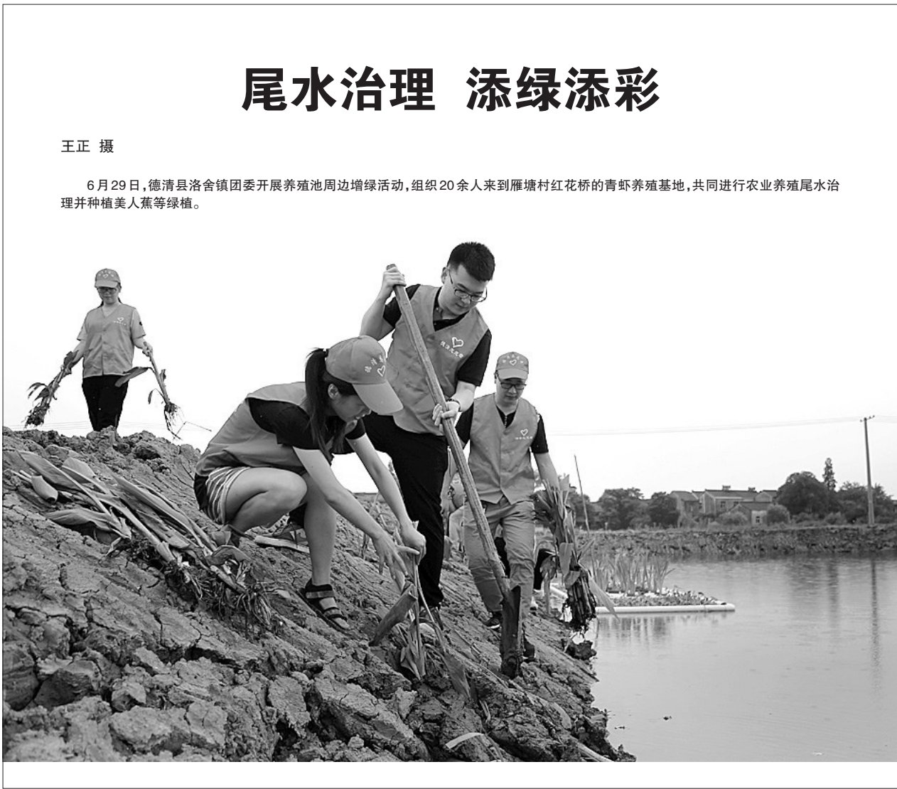
尾水治理 添绿添彩 6月29日,德清县洛舍镇团委开展养殖池周边增绿活动,组织20余人来到雁塘村红花桥的青虾养殖基地,共同进行农业养殖尾水处理并种植美人蕉等绿植。

事实上存在同等过错,应各负50%的责任,法院判决中升公司按该责任比例赔偿安利特公司的货物价值及仓储费用。 “托运人委托货运代理人代为订舱报关时,应事先充分了解货物、收货人、目的港基本情况,并向代理人作出准确指示。”邬先江提醒说。 货运代理的业务范围涉及货物出口的各个环节,基本上触及海上货物运输有关的岸上物流全过程,包括订舱、报关、报检、包装、仓储、拖卡等琐碎、繁杂的事务,每一个环节稍有不慎就可能出现纰漏,酿成纠纷。 对此,海事法院昨天在发布会上也给出相关建议,比如要提高风险意识,选择有一定实力和规模的货运代理人进行交易,并谨慎审查对方的无船承运人资质。在预防货代纠纷方面,要注意留存证据,保留支付凭证及垫付依据,注意电子证据的搜集和保存,切勿删除电脑数据或同步云端。货运代理人在接受委托时应向托运人明示扣单权;若未表明该权利的,可以扣留除海运单、提单以外的其他单证。