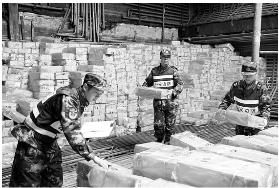
边防官兵清理冻品

本报讯 一艘外籍运输船,停靠在人烟稀少的宁波峡山沙场码头,期间有多辆运输车靠近,一到夜间就有人鬼鬼祟祟地卸货。近日,宁波海关查获一批来自疫区的走私冻品,累计重量达1400吨。昨天,宁波海关联合宁波市口岸与打击走私办公室、公安边防支队、出入境检验检疫局,在宁波中科绿色电力有限公司,对宁波海关破获的首起利用外籍船舶绕关走私进口冻品案中的在扣冻品进行集中销毁。 今年3月,宁波海关接到线索,有一艘外籍运输船停靠在