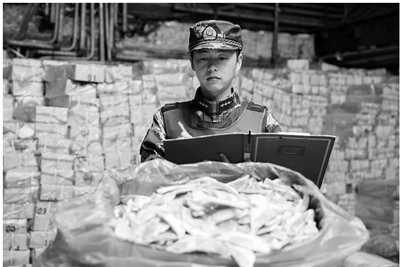
边防官兵对冻品进行核对