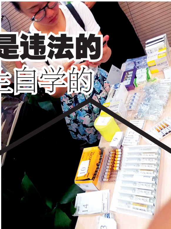
执法部门缴获的假药