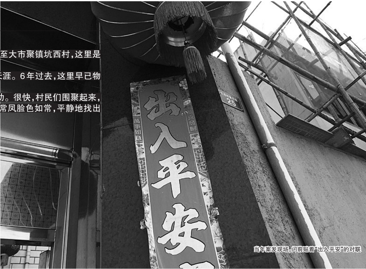
当年案发现场,门前贴着“出入平安”的对联

娘。“每次来,他都话很少。有一次,我们包子卖完了,和他说再等2分钟,他没吭声,转头就走了。”