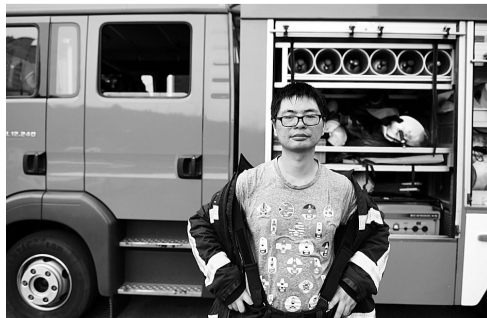
完成演练体验任务的记者整个人像水里捞出来一样