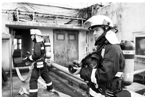
水带铺设完成后，消防员随时准备出水