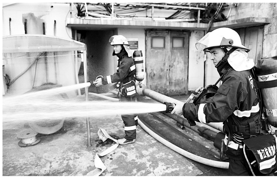
随着水压的增高，消防员艰难抱住水枪