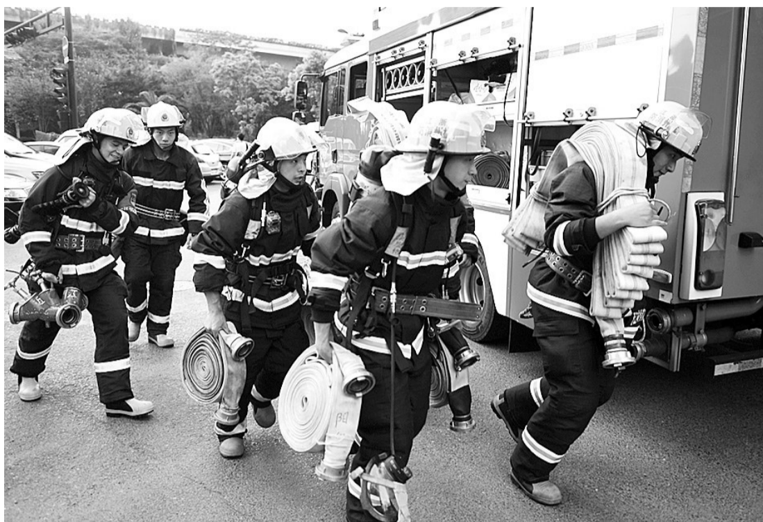
全副武装的消防员开始铺设高层水带

向指定位置奔跑过去。他们两人一组，配合十分娴熟，水带犹如一条条巨蟒，不断向大楼内延伸。