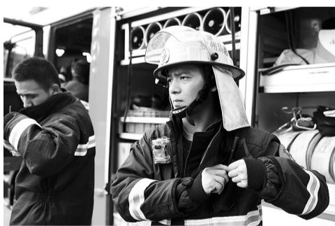
演练中的消防员必须全副武装