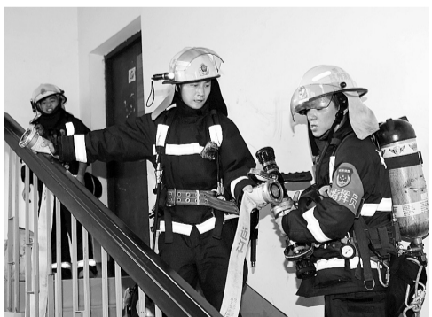
到达顶层后，战斗员将水枪接到水带上