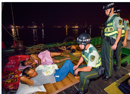
卸货后，疲惫不堪的渔船民就地打盹，巡逻民警不忘安全提醒