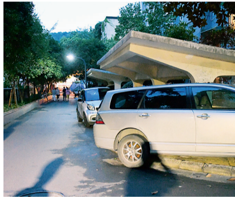
小区内车辆随意停放现象严重