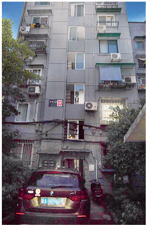
居民楼的楼道口停满私家车