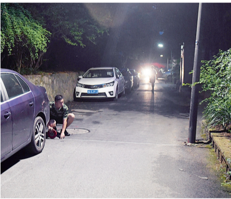
现场测量道路仅剩2.4米