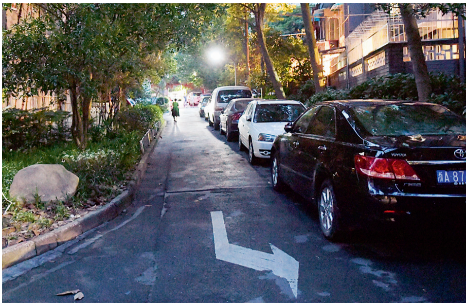
道路一侧停满了私家车