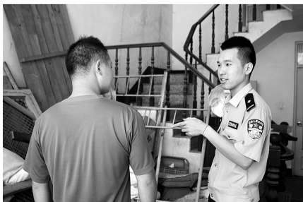
民警及时找到工地老板