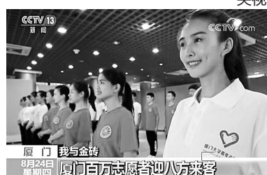
厦门 我与金砖 8月24日 星期四 厦门百万志愿者喜迎八方来客

9月3日,金砖国家领导人第九次会晤将在福建厦门举行。“金砖”成为人们口中的热词。会晤期间,厦门将有超过100万的志愿者,为来自世界各地的嘉宾友人提供服务。