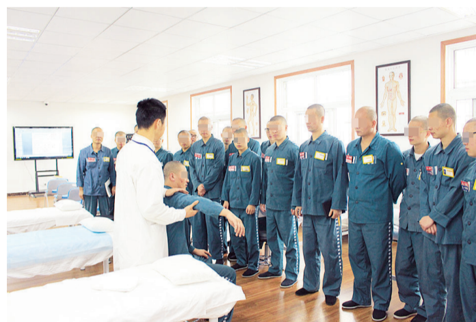
监狱开设钱江转窑等职业技能实训项目

在加快硬件建设的同时,省乔司监狱结合智能化现代文明监狱的创建成果,充分利用教育专网的全网通功能,开通了“修心教育”体验馆、“修心教育”成果展示馆、“修心教育”职业技能实训基地的网络版,通过将“两馆一基地”由线下延伸至线上,解决了因点多面广造成的教育时间和空间上的限制,使职业技能实训由单一的线下展示扩展为全员的在线培训,实现了师资共享和技术共享。为推广和方便服刑人员上网学习,监狱还在监舍标准化改造过程中积极探索“电子阅览室进小组”。