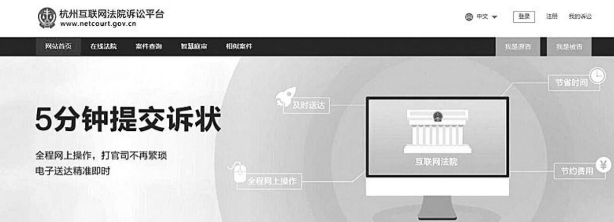
杭州互联网法院诉讼平台首页