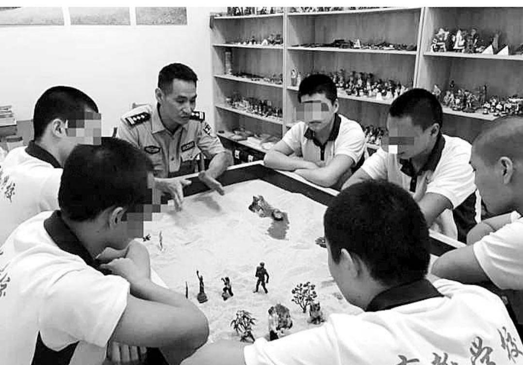
通过沙盘游戏课挖掘潜能