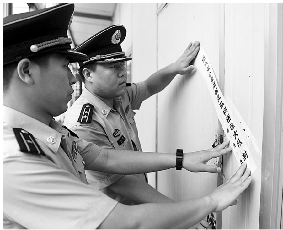
现场查封用彩钢板搭建的违章建筑

在酒店5层的餐厅,消防检查人员又指出了多处消防安全隐患——设置在墙体上的消火栓箱内,消防卷盘管体多处断裂,