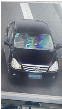
嫌疑人用来运毒的车辆