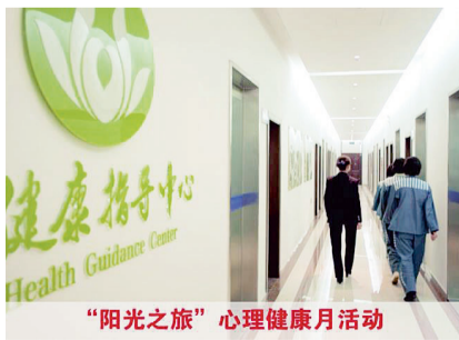
“阳光之旅”心理健康月活动

初秋的阳光越过余杭塘河边的柳梢,越过高墙,洒落进十监区的心灵小栈“阳光花园”,将这里装点得更加温馨。