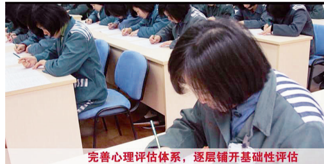
完善心理评估体系,逐层铺开基础性评估