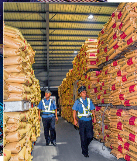
民警穿梭在堆场中