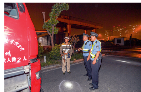
巡查大货车占道情况