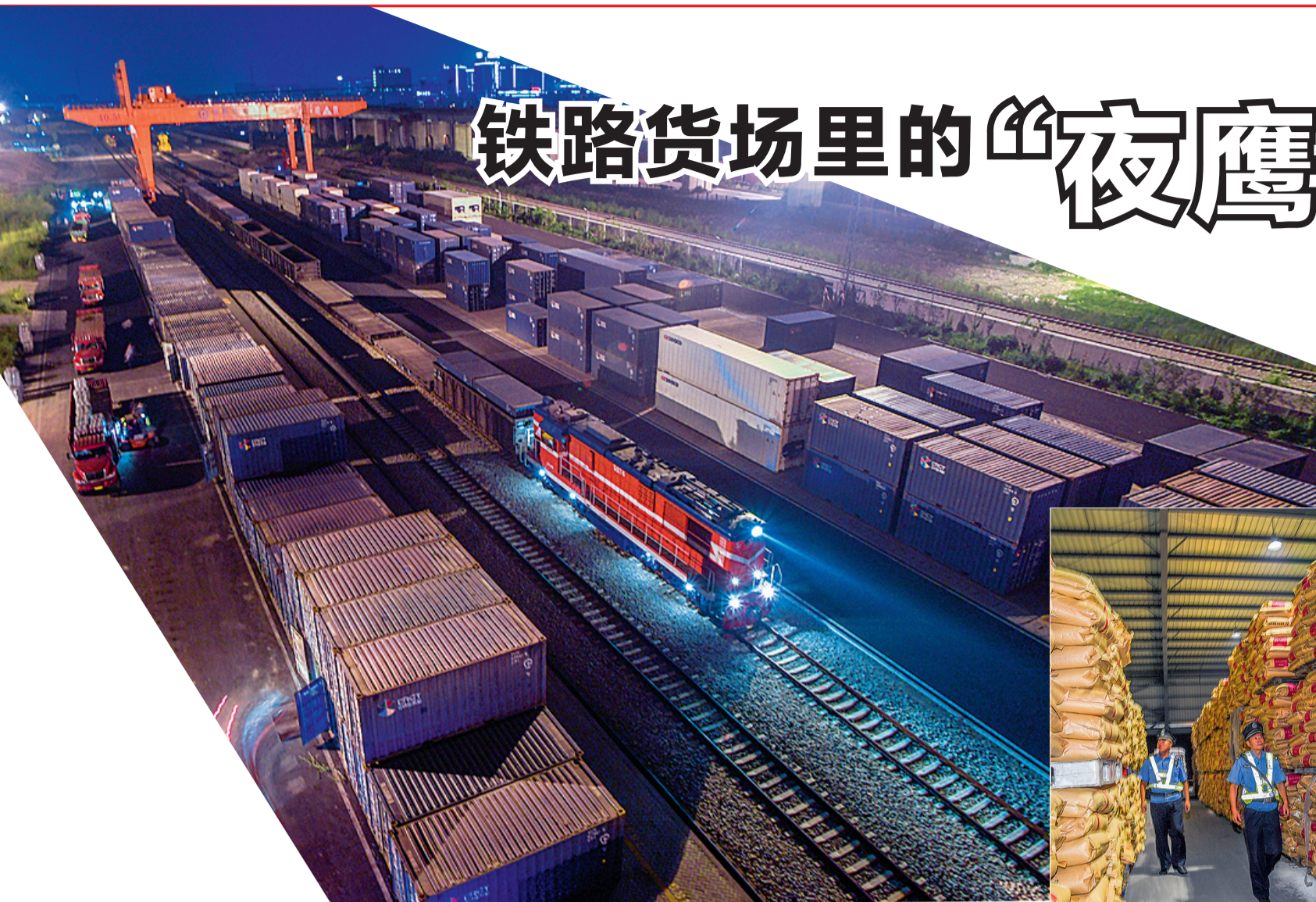
昼夜忙碌的永宁货场