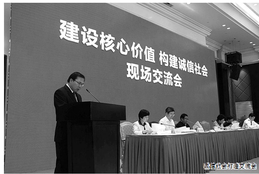
诚信会打建交流会

针对不同的纠纷类型,义乌法院分别引入不同的行政机关和社会团体参与纠纷调解。“我们联合中国互联网协会、义乌市市场监管局、市司法局等单位,构建了全国首个吸收社会中介组织参与的知识产权民事纠纷诉调对接第三方平台——义乌市知识产权诉调对接中心。”义乌法院相关负责人说。