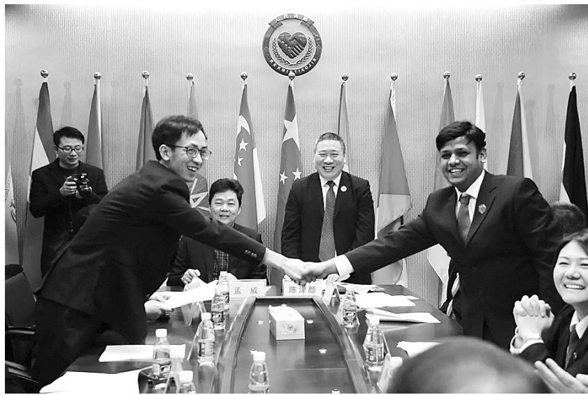
外调委与律所签署合作协议

外调委还开展了形式多样的文化交流活动。每年7月,各国调解员都会前往义乌国防教育基地参加军训,通过军事化的管理,加强了自我约束力,也增加了他们对“诚信”“包容”等理念的认同感,提升了他们参与城市治理的热情,为义乌这座“没有围墙的城市”增添了新活力。