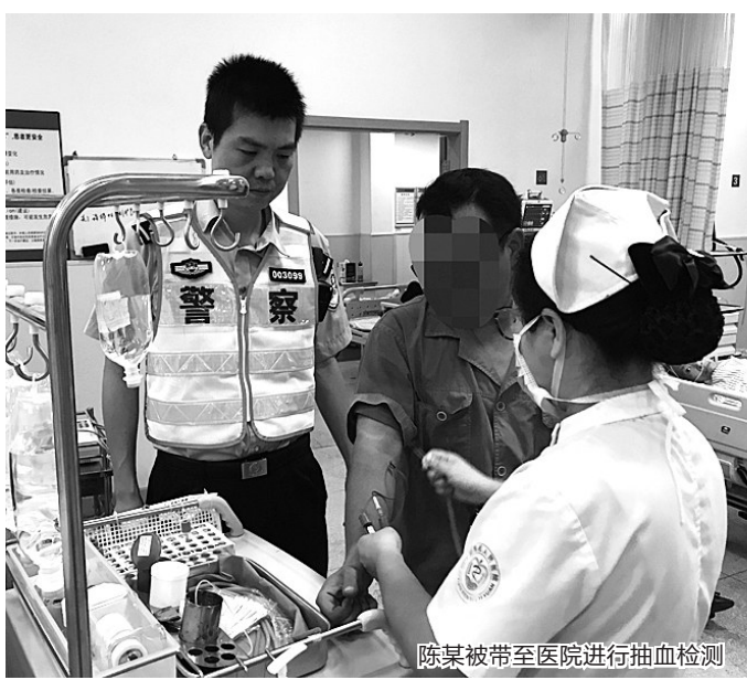
陈某被带至医院进行抽血检测

让人哭笑不得的是,在医院做完血液抽检后,该男子向民警询问自己可能会被关多久,民警答复这需要法院来裁决时,他“不乐意”了,“豪气”地说:“我要是只被法院判三五个月就没有意思了,要判,就判个三五年,不然不过瘾……”“这会儿血也抽好了,我请你们几位‘阿Sir’去吃个