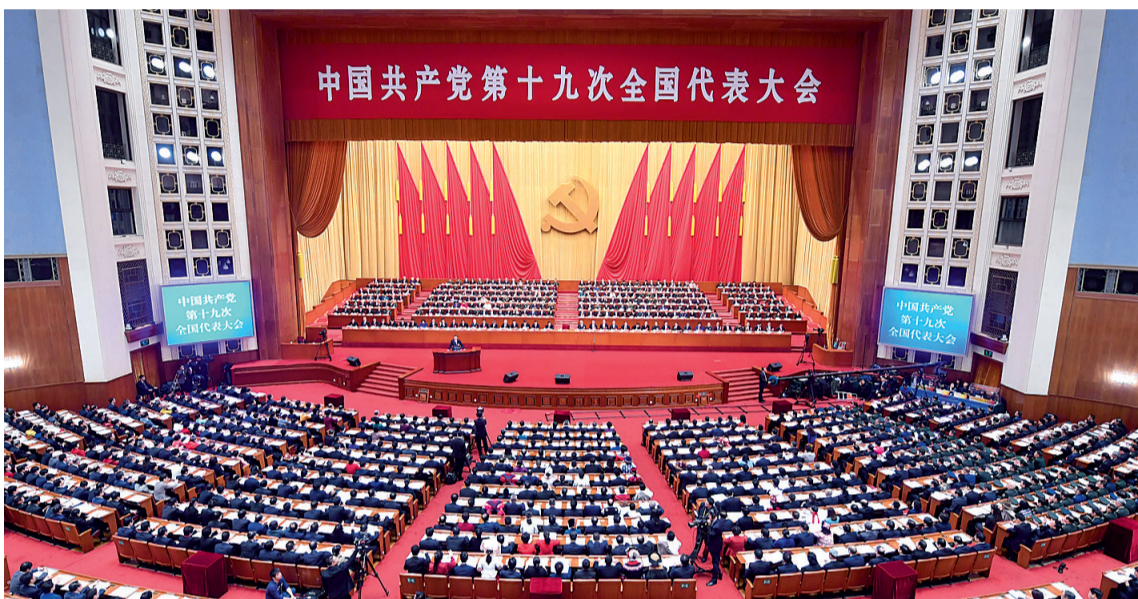
10月18日,中国共产党第十九次全国代表大会在北京人民大会堂开幕。习近平代表第十八届中央委员会向大会作报告。