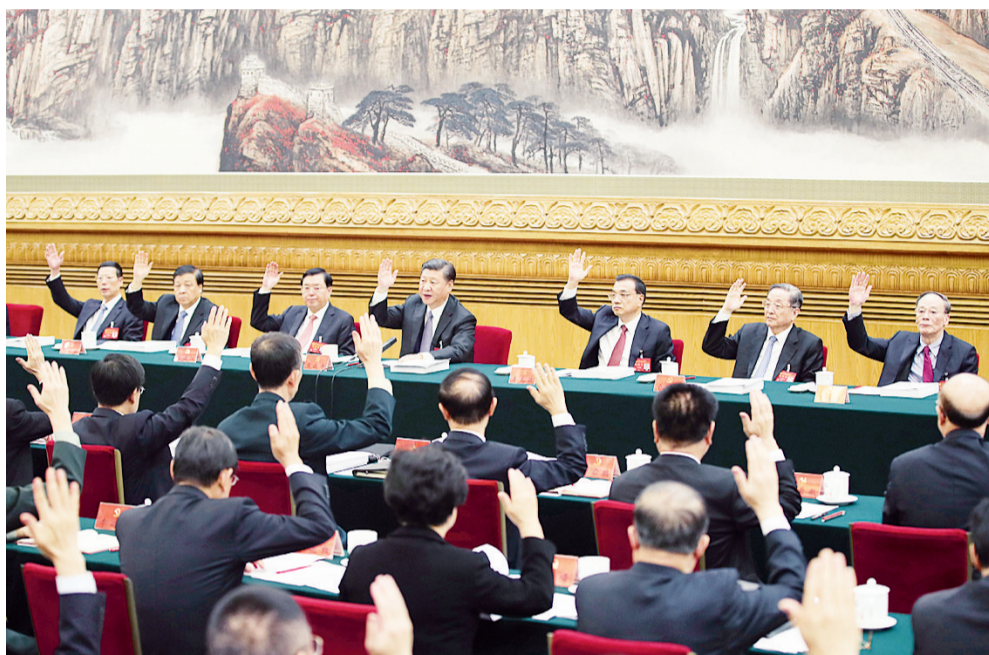
10月23日,中国共产党第十九次全国代表大会主席团在北京人民大会堂举行第四次全体会议。习近平同志主持会议。