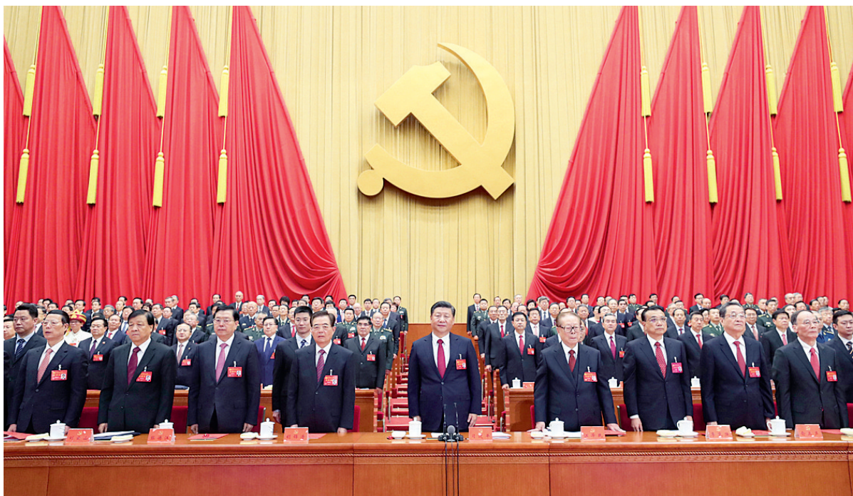
10月24日,中国共产党第十九次全国代表大会在北京人民大会堂胜利闭幕。这是习近平、李克强、张德江、俞正声、刘云山、王岐山、张高丽、江泽民、胡锦涛在主席台上。

新华社北京10月24日电 中国共产党第十九次全国代表大会在选举产生新一届中央委员会和中央纪律检查委员会,通过关于十八届中央委员会报告的决议、关于十八届中央纪律检查委员会工作报告的决议、关于《中国共产党章程(修正案)》的决议后,24日上午在人民大会堂胜利闭幕。