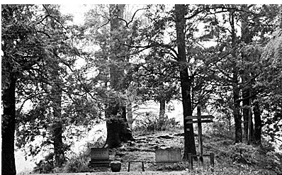
宁波海曙区茅湾村古树林(资料照片)

市绿化条例》等。其中虽然对古树名木的保护也有一些规定,但都比较笼统,特别是对一些古树名木的破坏行为,没有量化的处罚措施,执法比较困难。而这次我省施行的法规,操作性更强。《浙江省古树名木保护办法》规定,古树按照级别分级保护。500年以上的一级古树要上报省里,树龄300年以上不满500年的上报市里,其他的古树由县一级负责。名木则实行一级保护。此外,针对一些损害古树名木的行为,《办法》也有具体规定。比如,擅自砍伐、采挖或者挖根、剥树皮的,按《浙江省森林管理条例》规定处罚;构成犯罪的,追究刑责。在古树名木保护范围内新建扩建建筑物和构筑物、挖坑取土、动用明火、排烟、采石、倾倒有害污水和堆放有毒有害物品等行为,可处5000元以上1万元以下的罚款;情节严重的,处1万元以上10万元以下的罚款;构成犯罪的,追究刑责。刻划、钉钉子、攀树折枝、悬挂物品或者以古树名木为支撑物,可处200元以上2000元以下的罚款;情节严重的,处2000元以上3万元以下罚款。