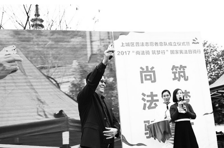
上城区司法局局长高燕东为骑行活动开幕鸣枪

在杭州市上城区，活跃着一群暖心的身影，他们是社区热心人士、机关党员干部、法律工作者、人民调解员、青年学生、教师……他们年龄不同、身份不同、职业不同。他们立于岗位、扎根基层，活跃在老百姓身边，以各种形式义务开展法治宣传教育。他们有一个共同的名字：上城区普法志愿者。