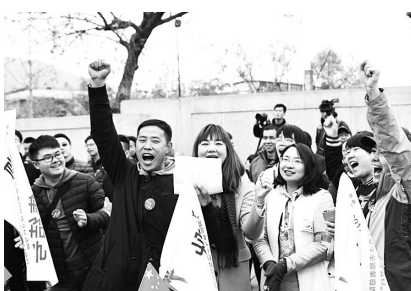
出发前各队选手高喊口号

“法随我动，骑乐无穷！”“不忘初心，逐梦前行！”在一声声响亮的口号声中，百余人的参赛队伍出发了。每到一处站点，选手们都要根据任务卡的要求答题闯关。或是回答宪法知识问答，或是书写法治宣传口号，并集体合影……每一辆单车车头飘扬的五星红旗，传递着普法志愿者们弘扬宪法精神的决心；选手们齐心协力答题闯关的过程，更是传递出满满的正能量。