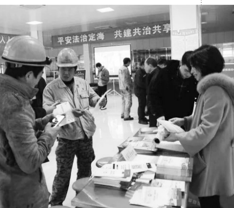
舟山市定海区普法志愿服务队走进舟山长宏国际船舶修造有限公司,向600余名企业员工提供法律咨询

浙江一直是“海上丝绸之路”的重要参与者。如今,“一带一路”为浙江经济腾飞带来新动力。机遇面前,浙江企业参与国际竞争、开拓国际市场的意愿愈发强烈。在走出国门的同时,各类法律风险也随之增加。2017年,各级司法行政机关不断创新法律服务“一带一路”举措,从优化服务程序、提高服务质量出发,为浙江企业走向国际市场提供便捷服务。