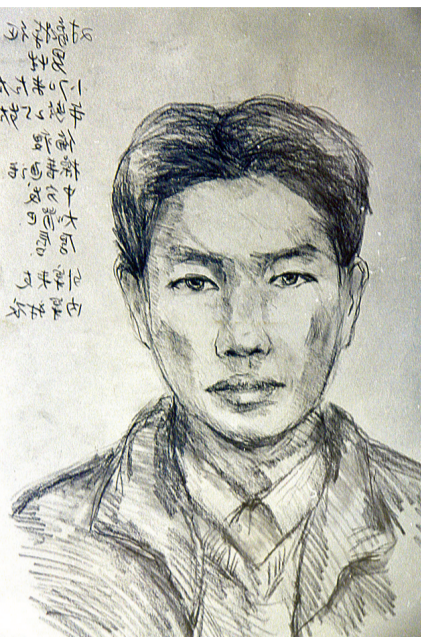
警方当年模拟画出的嫌疑人面部特征