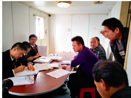
法官上船指导船员填写起诉状等诉讼材料

然而,航运公司在签署调解协议后,并未自动履行付款义务。2017年9月25日,银行方面向海事法院申请强制执行,并于同年10月提出要求扣押“恒海16”