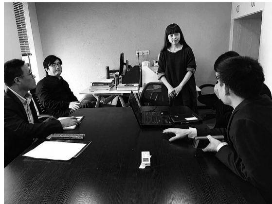
法律服务团为企业提供“法律体检”