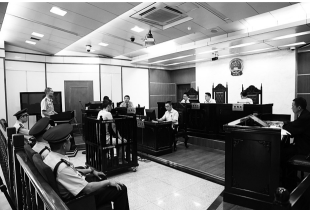
侦查人员出庭作证