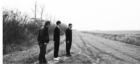
检察官查看耕地复垦情况