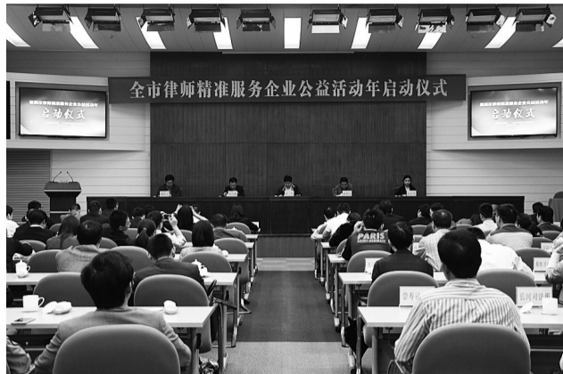
“律师精准服务企业”启动仪式现场