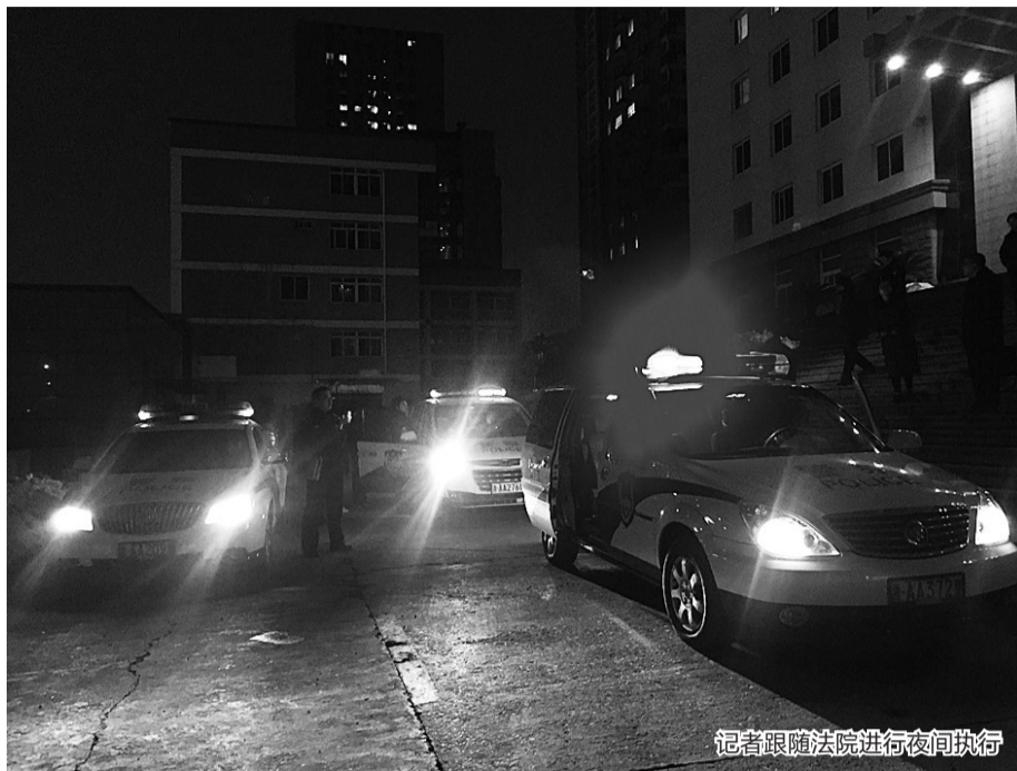
记者跟随法院进行夜间执行

2月6日晚，记者跟随执行法官们开展了一次夜间执行，傍晚六点，华灯初上，一辆辆闪烁着警灯的警车从法院鱼贯而出。平时打多个电话不接、发多少次传票也不露面的“老赖”在这样的夜晚，终究将“倦鸟归林”。