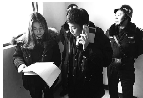
执行人员在部署工作

经过两个昼夜的奋战，婺城法院本次行动共抓获被执行人51名，其中对15名拒不履行的“老赖”采取司法拘留措施，为127件涉民生案件的149名当事人执行到位标的额318.83万元。