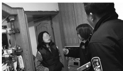
执行人员与被执行人交涉

经过调查，林女士没有工作，名下无房、无车、无存款，连如今住的房子都在前夫名下。不过，林女士和前夫尽管离婚了，但还是住在同一个屋檐下。执行阶段，王法官曾电话联系过林女士，但林女士说，继母对她并不好，小时候放学回家都没有热饭吃，现在自己没工作，也没钱付医疗费。说到激动处，她甚至摔了电话，此后，王法官就再也打不通林女士的电话了。