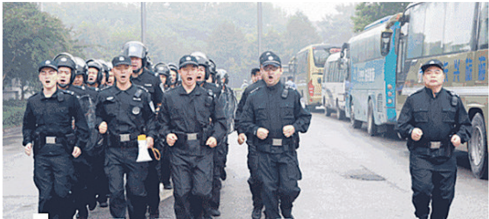
长兴警方打击犯罪