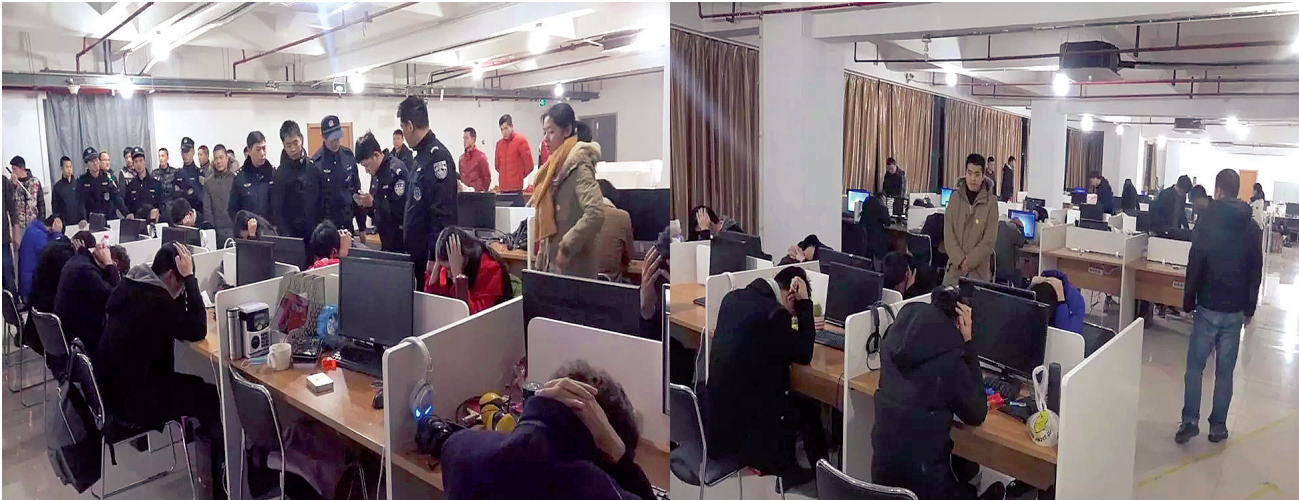
“浙江华恩”总部抓捕现场

警方通过侦查发现,“浙江华恩”是某省一家邮币卡交易平台的会员单位,通过邮币卡进行诈骗,全国大约有1.8