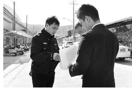
法院干警送达法律文书