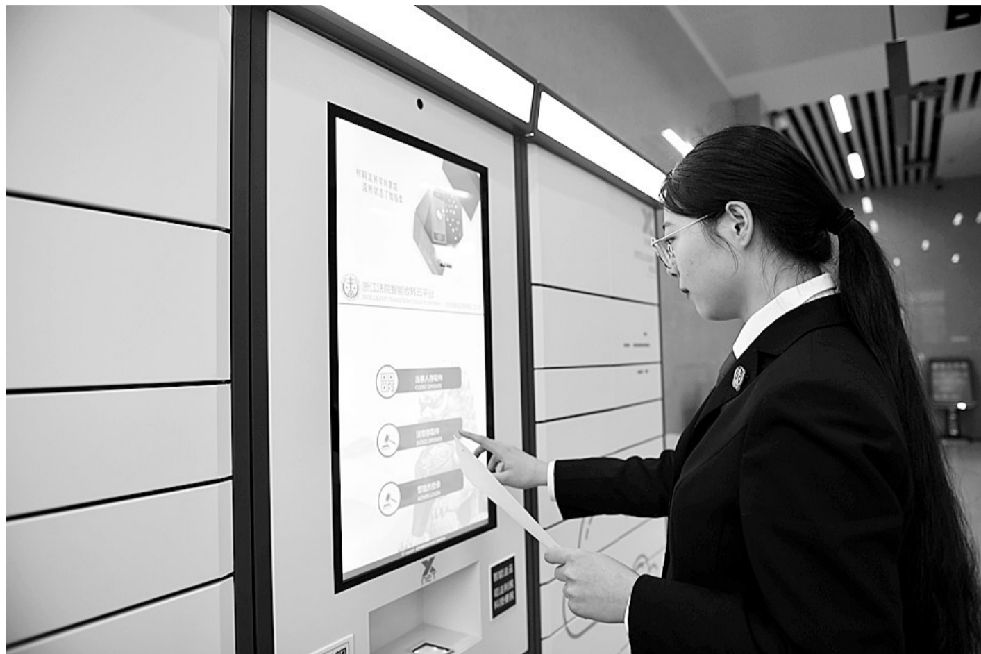
法院工作人员进行云柜送达

去年以来,玉环法院以解决送达难为重要抓手,积极推广电子送达,探索微信、短信、彩信送达,尝试原告送达,购买邮政服务进行集中送达等举措,不仅减轻了当事人讼累,且以多元化、人性化的服务进一步提高了送达质效。